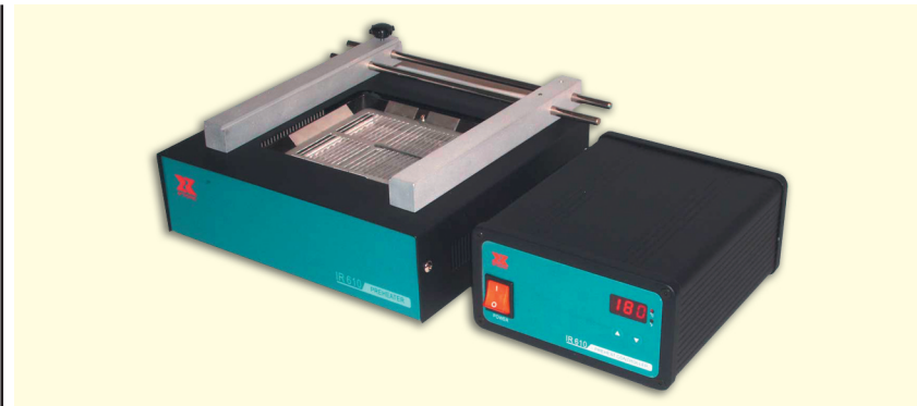
Рис. 5. Кварцевый инфракрасный (ИК) подогреватель печатных плат IR-610

которых просто невозможен без предварительного нагревателя. Количество слоев современных печатных плат может достигать до 24-х и не каждый из этих слоев сигнальный, как правило, есть слой заземления или экранирующие, представляющие собой слой меди относительно большой площади. И безопасный ремонт компонента на такой печатной плате без риска его перегрева паяльником при отсутствии предварительного нагрева практически невозможен. ИК подогреватель комплектуется держателем печатных плат размером до 450 × 455 мм.