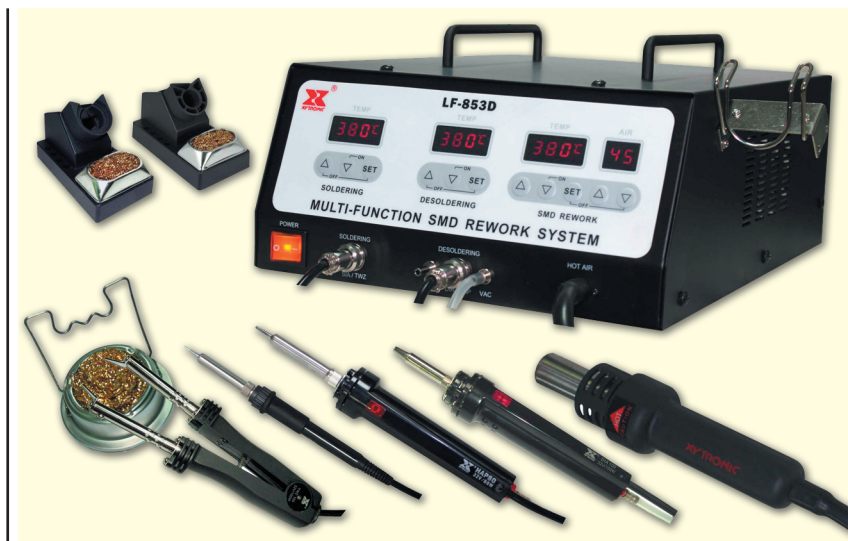
Рис. 1. Цифровой ремонтный паяльный комплекс LF-853DTP

Паяльник модели 307A имеет малый вес и габариты, при этом рассеивая мощность 90 Вт, которая требуется для качественного монтажа бессвинцовых