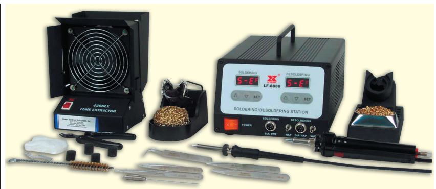
Рис. 2. Микропроцессорная цифровая ремонтная паяльная станция LF-8800

Новая микропроцессорная цифровая ремонтная 2-канальная паяльная станция модели LF-8800 разработана специально для удовлетворения текущих и будущих требований к монтажу/демонтажу компонентов, смонтированных по бессвинцовой технологии пайки. Станция имеет 2 канала для подключения термоинструмента: один для подключения паяльника 307A и термопинцета TWZ-90, второй — для вакуумного паяльника DIA-100 и минитермофена HAP-80. В станцию встроен высокоскоростной бесшумный безмасляный компрессор, управляемый электроникой, обеспечивающий глубину вакуума более чем 60 см/Нг. Управление компрес-