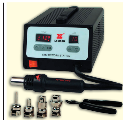
Рис. 4. Цифровая термовоздушная станция LF-852D

Термовоздушная станция LF-852D с цифровыми индикаторами температуры и потока воздуха применяется для ремонта и сборки электронных устройств. Система увеличивает производительность труда при сборке электронных