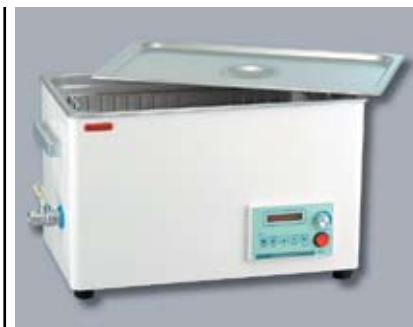
Рисунок 8 Цифровая УЗ ванна SD-D400H