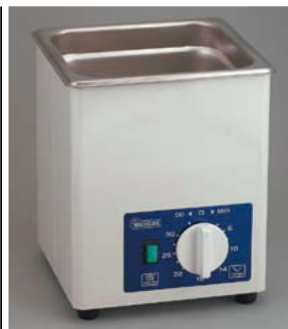
Рисунок 2 Аналоговая УЗ ванна SD-120H

УЗ ванны моделей SD-80H и SD-100H (рис. 1) снабжены двумя переключателями включения/отключения УЗ излучателя и нагревателя. Так как в этих системах отсутствует таймер, то время работы УЗ ванны регулирует оператор,