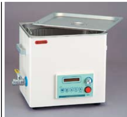
Рисунок 7 Цифровая УЗ ванна SD-D300H