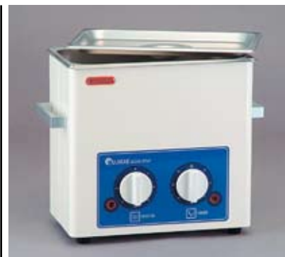
Рисунок 3 Аналоговая УЗ ванна SD-200H

это время не должно превышать 5 минут для обеспечения долговременного функционирования устройства.