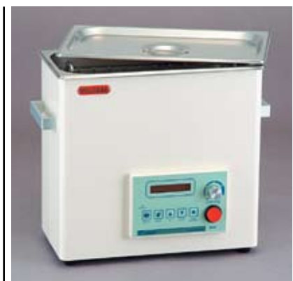
Рисунок 6 Цифровая УЗ ванна SD-D250H

зовательский интерфейс, позволяющий устанавливать время работы системы, температуру нагрева и мощность УЗ излучателя.