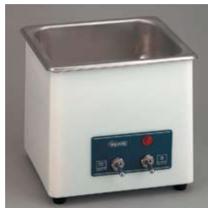
Рисунок 1 Аналоговая УЗ ванна SD-100H

Модель SD-120H (рис. 2) снабжена таймером для регулирования