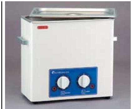
Рисунок 4 Аналоговая УЗ ванна SD-250H

Эта группа товаров представлена тремя моделями — SD-D250H (рис. 6), SD-D300H (рис. 7) и SD-D400H (рис. 8). Системы SD-D300H и SD-D400H оборудованы системами дренажа для отвода отработанной жидкости в канализацию или в специальные контейнера для последующей утилизации. В цифровых УЗ ваннах применен удобный поль-