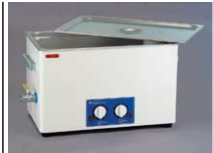
Рисунок 5 Аналоговая УЗ ванна SD-350H